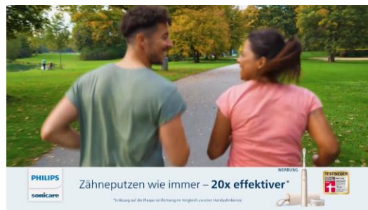
Über den 30" Content hinweg ist Sonicare präsent mit einer Bauchbinde, in der die Schlüsselkommunikation zum Produkt enthalten ist