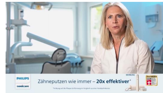
Einsatz einer Gesundheitsexpertin