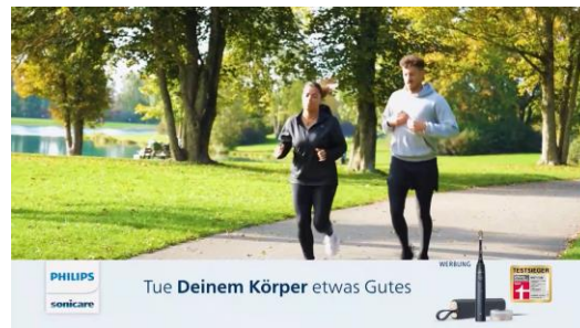
Start in den 30" redaktionellen Content zum Thema Mundhygiene als Teil der Gesundheit