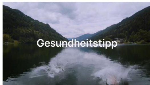
Einführung in den Spot durch Gesundheitstipp Klammer