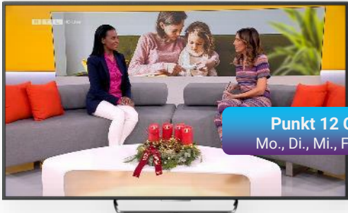
Punkt 12 Gesundheit Mo., Di., Mi., Fr. bei Punkt 12