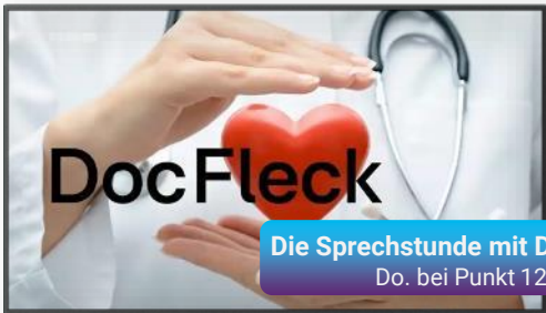
Die Sprechstunde mit Doc Fleck Do. bei Punkt 12