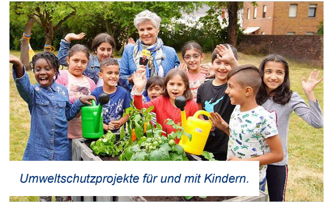
Umweltschutzprojekte für und mit Kindern.