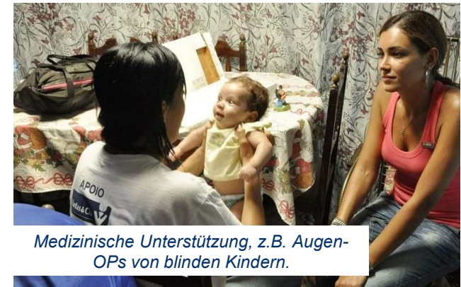
Medizinische Unterstützung, z.B. Augen-OPs von blinden Kindern.