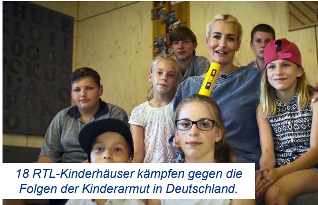
18 RTL-Kinderhäuser kämpfen gegen die Folgen der Kinderarmut in Deutschland.