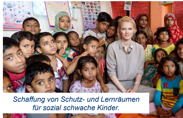
Schaffung von Schutz- und Lernräumen für sozial schwache Kinder.