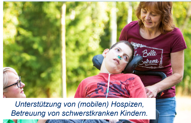
Unterstützung von (mobilen) Hospizen, Betreuung von schwerkranken Kindern.