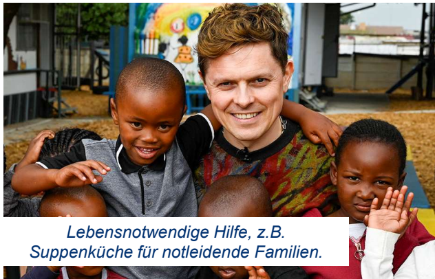
Lebensnotwendige Hilfe, z.B. Suppenküche für notleidende Familien.