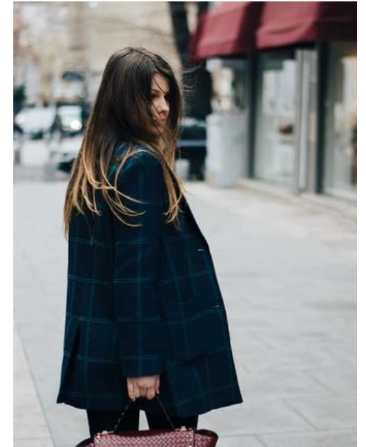
FASHION & BEAUTY